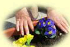
個々に合った作業を提供します。