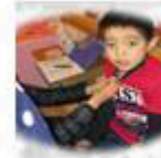
それぞれに応じた支援を行います。